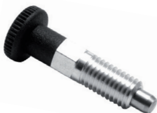
Version C avec écrou

Corps en acier zingué. Doigt en acier inoxydable.