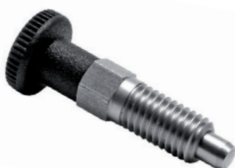
Version C avec écrou